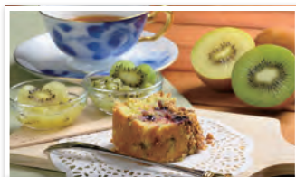
スイーツレシピ「ローマのキウイ日」

コンテストのテーマは「栄養士・管理栄養士を目指す学生の視点を活かした、キウイを使用したヘルシーでポジティブになれるレシピ」。500件を上回る応募の中、最終審査会に挑み、スイーツレシピ「ローマのキウイ日」で新宿高野賞【スイーツ部門】を受賞いたしました。