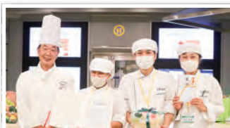
チーム名:「ミックスマツ」MIX NUTS コンテストの主催: 一般社団法人 全国栄養士養成施設協会

20代の女性をターゲットに特に不足しがちなビタミンCやカリウム、葉酸などを含むレシピを考案。ケーキの甘味にキウイのさっぱりとした酸味がアクセントになったお菓子。日ごろの学びの成果を存分に発揮しました。